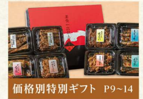
価格別特別ギフト P9~14