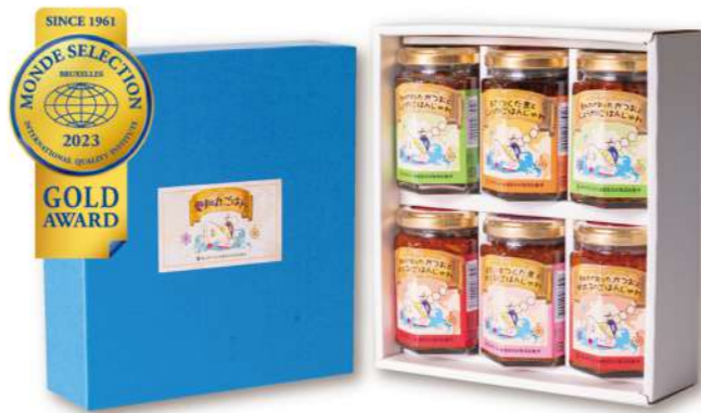
数量限定 愛知丸おすすめ6本セット 3,300円(税込)

賞味期限 冷蔵20日 8品 さんま蒲焼 75g・いわし甘露煮金ごま包み 75g・本はぜ甘露煮 75g 篠島産甘露ちりめん 40g・いわし甘露煮 75g・若さぎ甘露煮 70g 生むき志ぐれ 65g・あさり志ぐれ 65g