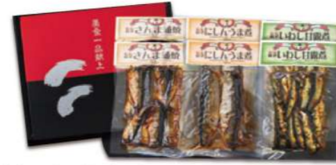
伝々おすすめセット 3,400円(税込)

賞味期限 常温365日 6品 愛知丸が釣ったかつおとしょうがのごはんじゅれ×2・あさりつくだ煮としょうがのごはんじゅれ・篠島しらすつくだ煮と明太子 のごはんじゅれ・愛知丸が釣ったかつおと明太子のごはんじゅれ×2(内容量各155g)