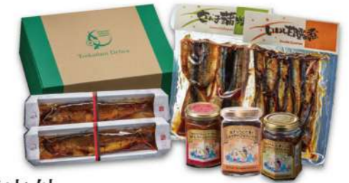
国内外 受賞記念セット〈梅〉 3,450円(税込)

賞味期限 冷蔵20日 6品 しいたけあさり 230g・さんま蒲焼 230g・いわし甘露煮金ごま包み 75g・ ししゃも 70g・あさり志ぐれ65g・篠島産甘露ちりめん 40g