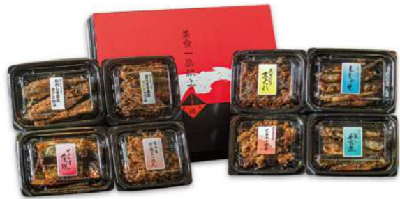
山吹 やまぶき 3,100円(税込)

賞味期限 常温120日 6品 さんま蒲焼 50g×2・いわし甘露煮 50g×2・あゆ甘露煮 1尾×2 (すべて真空)