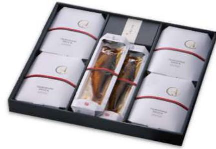
彗星 すいせい 3,000円(税込)

賞味期限 冷蔵20日 8品 いわし甘露煮 75g・若さぎ甘露煮 70g・いわし甘露煮金ごま包み 75g さんま蒲焼 75g・若さぎ甘露煮金ごまつみ 70g・あさり志ぐれ 65g ししゃも 70g・篠島産甘露ちりめん 40g