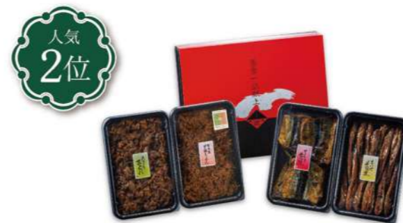
椿 つばき 4,300円(税込)

賞味期限 冷蔵25日 4品 あさり志ぐれ 230g・篠島産甘露ちりめん 120g・さんま蒲焼 230g 本はぜ甘露煮 230g