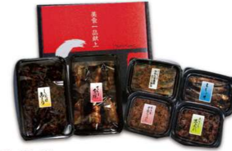
茉莉花 まりか 3,800円(税込)

賞味期限 常温120日 6品 伝々さんま蒲焼110g×2・伝々にしんうま煮2尾×2・伝々いわし甘露煮 140g×2(すべて真空)