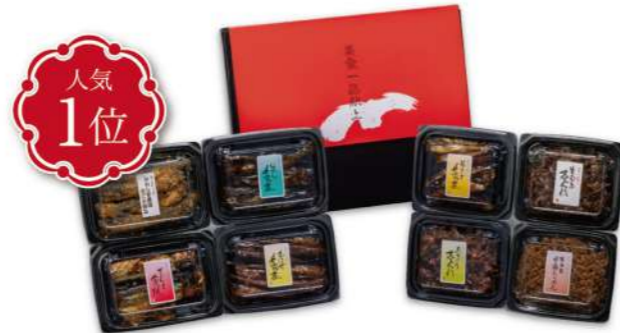
秋桜 こすもす 3,300円(税込)

賞味期限 冷蔵20日 8品 さんま蒲焼 75g・ししゃも 70g・篠島産甘露ちりめん 40g・くるみ 小女子 60g・いわし甘露煮金ごま包み 75g・若さぎ甘露煮金ごまつみ 70g・あさり志ぐれ 65g・いわし甘露煮 75g