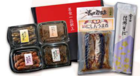
福寿草 ふくじゅそう 3,900円(税込)

賞味期限 常温120日 7品 あゆ甘露煮 1尾×2・さんま蒲焼 120g・いわし甘露煮 150g(各真空) 愛知丸が釣ったかつおと明太子のごはんじゅれ・あさりつくだ煮としょうがのごはん じゅれ・愛知丸が釣ったかつおとしょうがのごはんじゅれ(各内容量 155g)