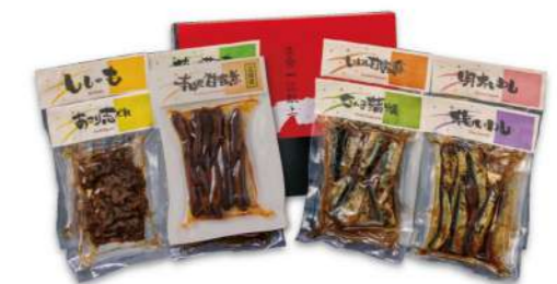
冬のきらり8品セット 4,900円(税込)

賞味期限 冷蔵20日 12品 さんま蒲焼 75g・しいたけあさり 65g・しょうがいわし 75g・篠島産 甘露ちりめん 40g・本はぜ甘露煮 75g・あさり志ぐれ 65g・若さぎ甘 露煮 70g・しそ昆布 60g・生むき志ぐれ 65g・いわし甘露煮 75g 若さぎ甘露煮金ごまつみ 70g・いわし甘露煮金ごま包み 75g